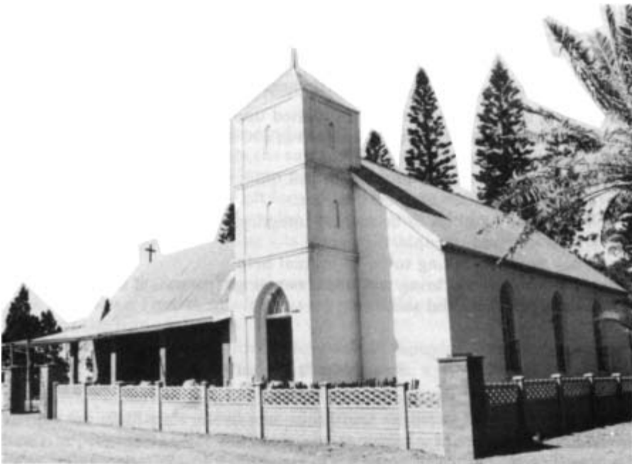
Den norske kirken i Marburg, Sør-Afrika

Med manglande kunnskap, fylgjer synsing. Den dag i dag trur nordmenn flest til dømes at det berre var norske misjonærar som slo seg ned i det sørlige Afrika. I røynda var dei norske misjonærane som kom til Zululand i 1840-åra, svært få. Sjølv på det meste, omkring 1920, telde dei berre omkring 50 vaksne menn og kvinner. Samstundes