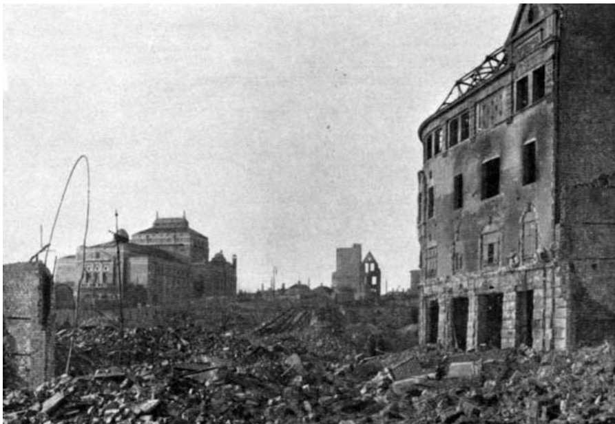
BERGENSRANNE: Søndag 16. januar for 90 år siden så Bergen sentrum ut som en bombet by. Ca. 70 mål var utbrent, og de nøkterne oversikter forteller at brannen ødela 380 bygninger. Her fra Veiten.

I våre dager, med lørdagsfri for de fleste, er det nesten utenkelig at folk for 90 år siden måtte streve og slite til lørdag kveld, før de kunne ta helg. Men slik var det. Og lørdag 15. januar 1916 hadde de det ekstra travelt i J. Berstads pakkbod ved sjøen mot Muralmenningen. Det var vareopptelling etter nyttår - og noen rør skulle registreres inne i boden. Det var da det fatale skjedde. Bodens elektriske lys i alle rom, men ikke i gangene. For å lyse opp slik at han som registrerte rørene kunne se