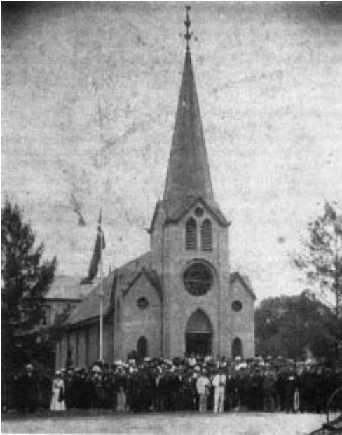
Den norske kirken i Durban. Samlingssted for utvandrede nordmenn

vilje til forsoning, noko som mellom anna resulterte i at det i 1910 vart oppretta eit samla Sør-Afrika Samband med ein boergeneral som fyrste president. Til skilnad frå Europa – der krig mange gonger har gitt sår som det har teke generasjonar og hundreår å lækja – så fann dei få kvite der sør at samhold var det einaste som kunne gje dei politisk styrke.