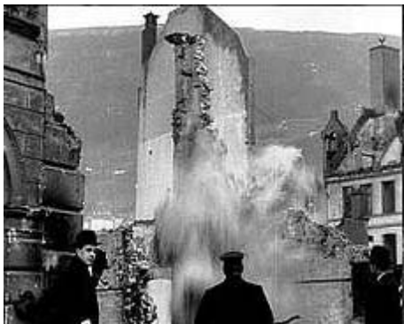
BERGENSBRANNEN: Dette bildet er tatt fra en unikt film tatt opp dagen eller dagene etter Bergensbrannen i 1916, og blir å finne i den nye filmen om nordmennenes historie.

bikkmeter vann fra vannverket, men dette var ikke merkbart i bassengene.